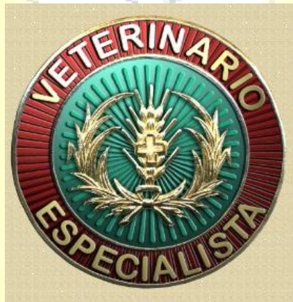
Distintivo de Oficial Veterinario Especialista

Al finalizar se les entrega el diploma acreditativo de sus estudios y el distintivo que les distingue.