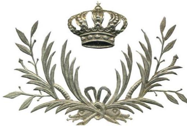
Histórico emblema del Cuerpo de Veterinaria Militar español (1908)

Con todo lo expuesto es conveniente reseñar que los muchos años de actividad de los mariscales al servicio de la corona; la actuación en varios conflictos bélicos; la participación en el tercer sitio de Gibraltar y el comportamiento leal en la guerra de la Independencia y guerras carlistas (sin dar motivos de queja, ni crítica a sus superiores ni a las autoridades militares) unido, todo ello, a que los mariscales debían ingresar por oposición y que además contaron con destacadas figuras de prestigio entre sus componentes con una excelente producción bibliográfica vino, todo el conjunto, a constituir un bagaje inmaculado que dio prestigio a sus profesionales. Basado en este rico acervo humano, patrimonial y cultural se constituyó en 1845 el Cuerpo de Veterinaria Militar, dotándoles de uniforme y emblema propio en 1856.