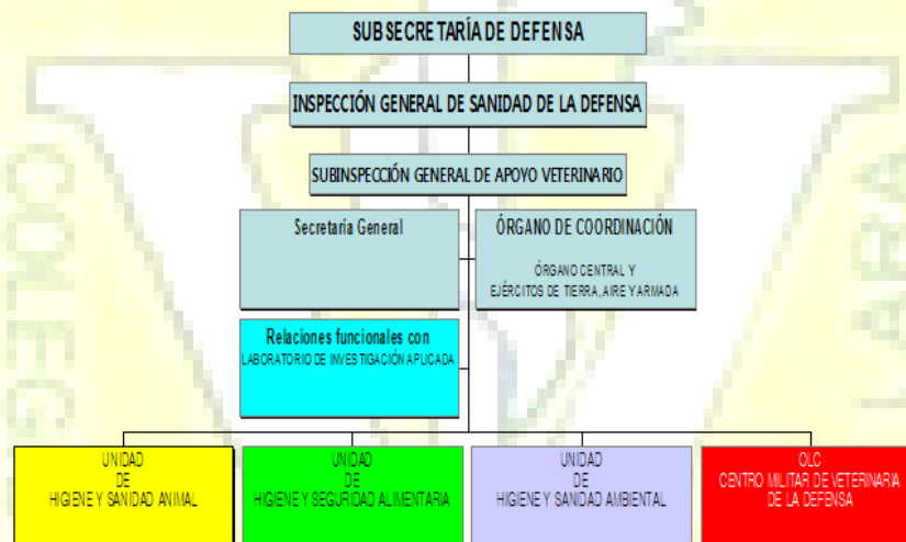
Organigrama del Centro Militar de Veterinaria