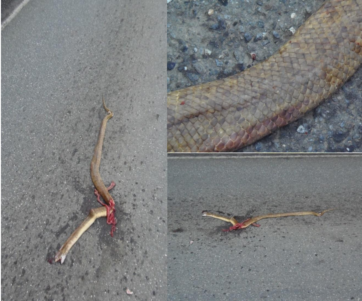
Figura 1: Ejemplar de Drymarchon caudomaculatus arrollado entre el Copey y las Veritas, Municipio Urdaneta, Estado Lara.

Urb. Nueva Segovia, calle 4 entre carreras 2 y 3, N° 2-41. Quinta CEProuna Teléfonos (0251) 719.22.83 – 240.63.66. Barquisimeto - Estado Lara RIF.: J-30496804-3 ppi: 201102LA3870 ISSN: 2244 – 7733 http://revistacvml.jimdo.com revistacvml@gmail.com